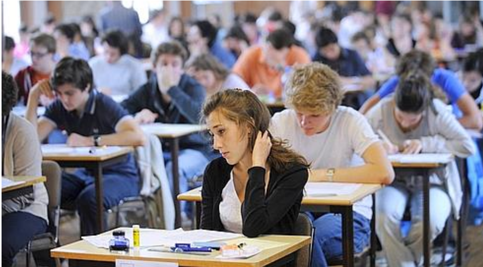
Des lycéens de terminale pendant la session 2009 du baccalauréat.

Ce document est extrait du site: www.lefigaro.fr , juillet 2010